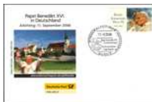
Papstbesuch - Altötting SSt Altötting 11.9.2006 BD-DP K 110906 4,90 €