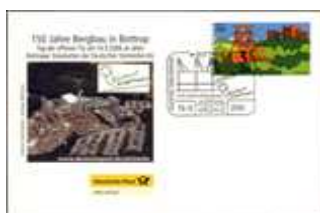
150 J. Bergbau in Bottrop SSt Bottrop 16.9.2006 BD-DP K 160906 4,50 €