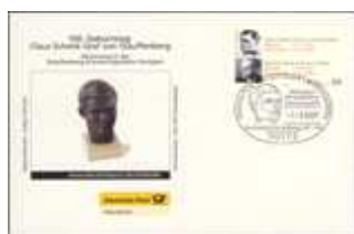
Graf von Stauffenberg SSt Stuttgart 1.3.2007 BD-DP K 010307 3,90 €