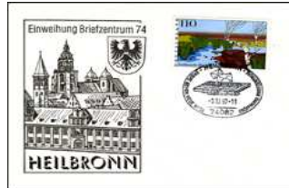
Eröffnung Briefzentrum Heilbronn SSt Heilbronn 9.12.1997 BD-DP K 091297 ausv.