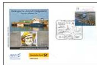
Biolog. Anstalt Helgoland SSt Helgoland 22.9.2007 BD-DP K 220907 ausv.