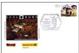
Limestag Saalburg SSt Bad Homburg 14.10.2007 BD-DP K 141007 ausv.