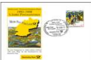
5 Jahre Postagenturen SSt Leissnitz 15.8.1998 BD-DP K 150898 5,50 €