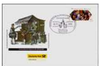
Nürnberger Christkindlmarkt SSt Nürnberg 28.11.2007 BD-DP K 281108

Hinweis: Belege deren Bezeichnung gelb unterlegt sind, sind auch als gelaufen mit Kodierung vorrätig