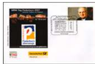
Nordrhein-Westfalen Tag SSt Paderborn 25.8.2007 BD-DP K 20807 B 3,90 €