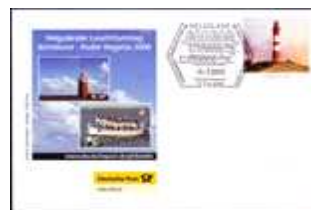
Helgoländer Leuchtturmtag SSt Helgoland 5.7.2008 BD-DP K 050708 4,50 €