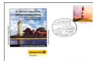
Dänisch/Deutsche Verb.Ausst, SSt Hamburg 7.11.2008 BD-DP K 071108 7,90 €