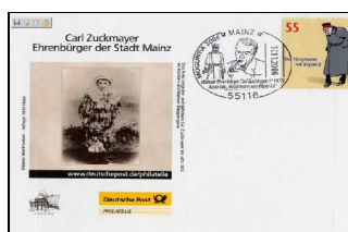
Carl Zuckmeyer, Ehrenbürger SSt Mainz 17.11.2006 BD-DP K 171106 ausv.