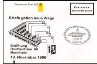
Einweih. Briefzentrum Mannheim SSt Mannheim 18.11.1996 BD-DP K 181196 ausv.