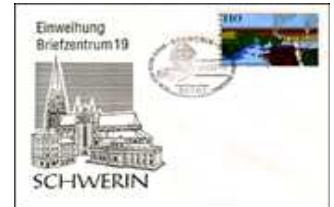
Einweih. Briefzentrum Schwerin SSt Schwerin 3.11.1997 BD-DP K 031197 5,50 €