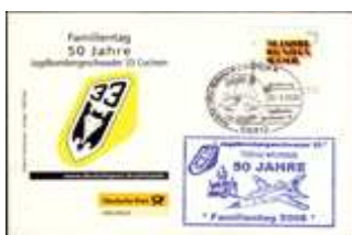
50 J. Jagdbombergeschwader SSt Cochem 20.9.2008 BD-DP K 200908 01 ausv,