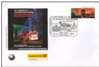
Landesfeuerwehrtag SSt Rotenburg/Fulda 23.8.2007 BD-DP K 230807 4,50 €