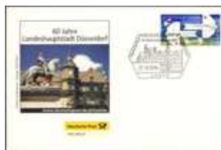
60 J. Landeshauptst. Düsseldorf SSt Düsseldorf 27.08.06 BD-DP K 270806 3,90 €