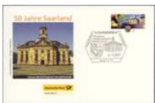
50 Jahre Saarland SSt Saarbrücken 2.1.2007 BD-DP K 020107 01 3,90 €