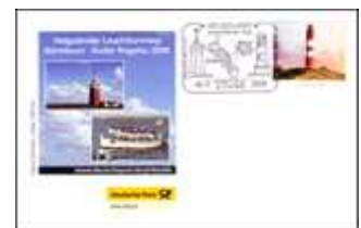
Helgoländer Leuchtturmtag SSt Helgoland 6.7.2008 BD-DP K 060708 4,50 €