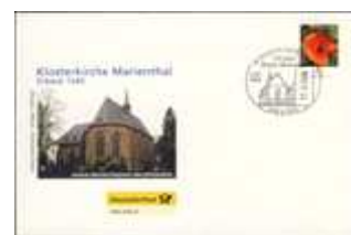
Klosterkirche Marienthal SSt Hamminkeln 17.06.06 BD-DP K 170606 3,90 €