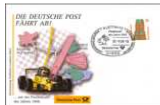
Postleitzahl u. Datum stimmt SSt Frankfurt/Oder 19.8.1997 BD-DP K 190897 4,50 €