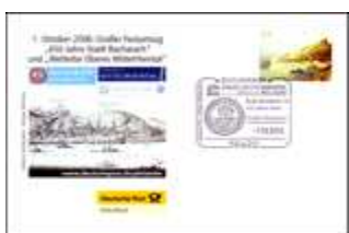
650 Jahre Stadt Bacharach SSt Bacherach 1.10.2006 BD-DP K 011006 ausv.