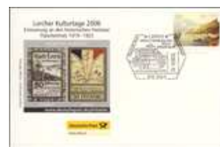
Lorcher Kulturtage 2006 SSt Lorch 24.9.2006 BD-DP K 240906 ausv.