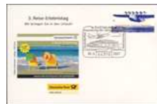
3. Reise-Erlebnistag SSt Dortmund 20.5.2007 BD-DP K 200507 3,90 €