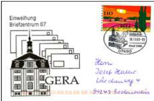
Einweihung Briefzentrum Gera SSt Gera 18.11.1997 BD-DP K 181197 5,50 €