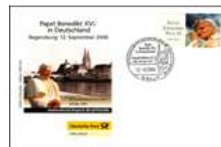
Papstbesuch - Regensburg SSt Regensburg 12.9.2006 BD-DP K120906 4,90 €