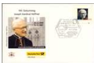
100. Geb.tag Kardinal Höffner SSt Köln 9.11.2006 BD-DP K 091106 ausv.