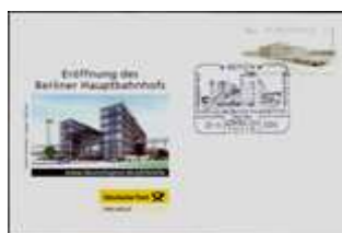
Eröffnung des Berliner HbHf. SSt Berlin 27.5.2006 BD-DP K 270506 ausv.