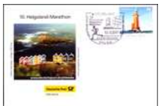
100 Jahre Leuchtturm Pellworm SSt Pellworm 4.5.2007 BD-DP K 040507 ausv.