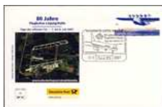
80 Jahre Flughafen Leipzig/Halle SSt Leipzig 7.7.2007 BD-DP K 070707 01 4,50 €