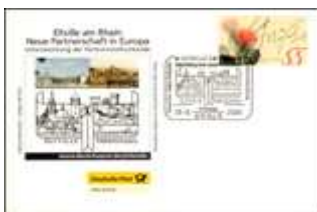
Eltville / Passignano Partnerschaft SSt Eltville am Rhein 26.8.2006 BD-DP K 260806 01 4,50 €