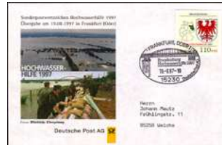
Hochwasserhilfe Überg. PWZ SSt Frankfurt/Oder 19.8.1997 BD-DP K 190897 5,50 €