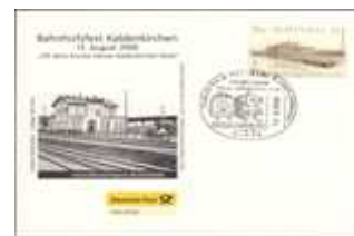
Bahnhofsfest Kaldenkirchen SSt Nettetal 13.8.2006 BD-DP K 130806 4,50 €