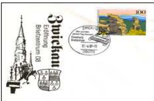
Eröffnung Briefzentrum Zwickau SSt Zwickau 17.4.1997 BD-DP K 170497 ausv.