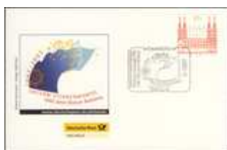
1000 Jahre Bistum Bamberg SSt Bamberg 2.1.2007 BD-DP K 020107 02 ausv.