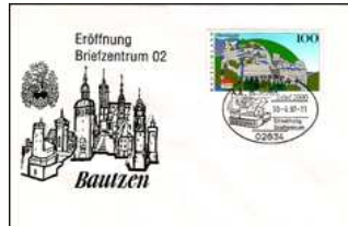
Eröffnung Briefzentrum Bautzen SSt Bautzen 30.4.1997 BD-DP K 300497 6,50 €