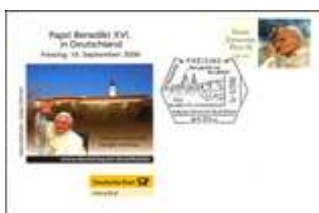
Papstbesuch - Freising SSt Freising 14.9.2006 BD-DP K 140906 4,90 €