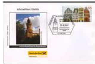
Altstadtfest Görlitz SSt Görlitz 25.8.2007 BD-DP K 250807 A 4,50 €