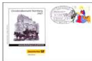
Nürnberger Christkindlmarkt SSt Nürnberg 30.11.2007 BD-DP K 301107 ausv.