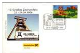
17. Großes Zechenfest SSt Essen 23.9.2006 BD-DP K 230906 4,50 €